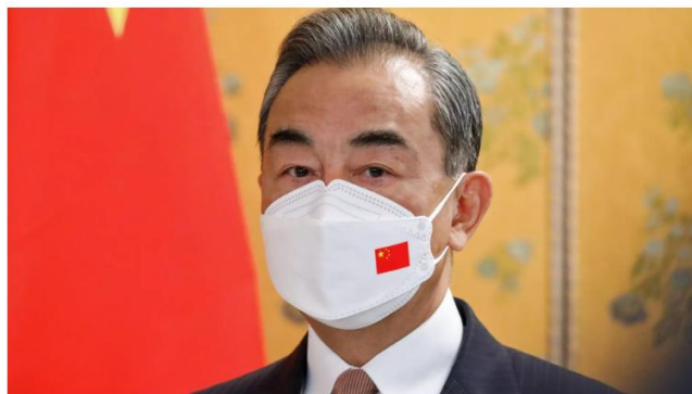
ورود به گالری تصاویر

28.05.2022 23:37 (بروز رسانی شده: 28.05.2022 23:38)