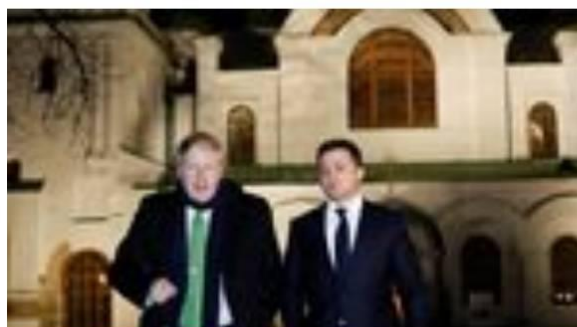
Johnson with Ukrainian President Volodymyr Zelenskyy in Kyiv.

Tory leaders looking to bolster their political fortunes could be making a negotiated end to the war harder to reach.